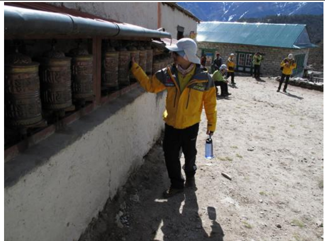
轉經輪，必須用右手轉動才是正確的方式