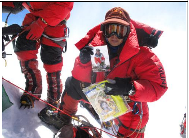
在峰頂與德雄老師拍張合照