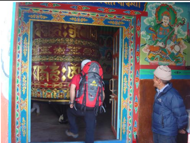
尼泊爾的信仰，轉動轉經輪祈求幸福