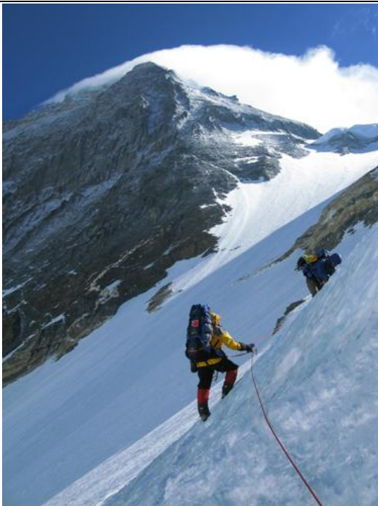
沿著雪坡往第四營前進