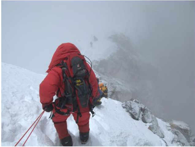
登頂後的下撤，必須格外的小心