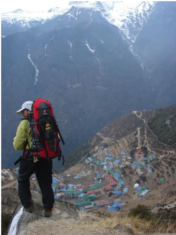
俯視著 Namche Bazar，像砍掉樹木的梯田