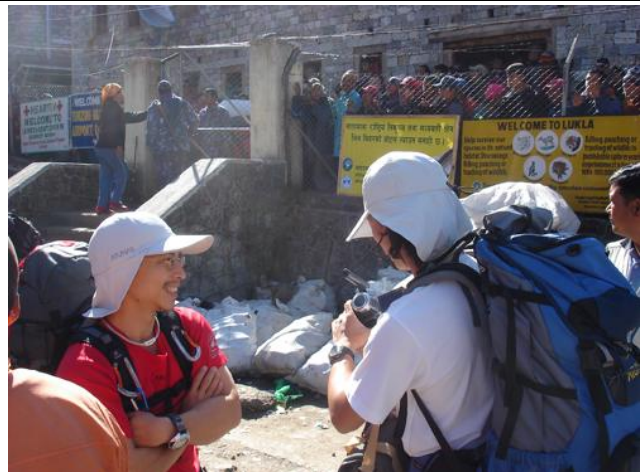
Lukla 機場外，等待工作機會的雪巴人