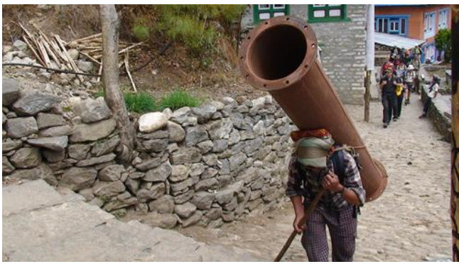
尼泊爾昆布山區重要的運輸載具-人力