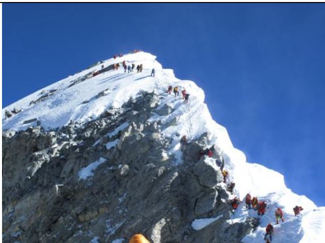
希拉瑞台階，遠方的雪巖就是世界之巔