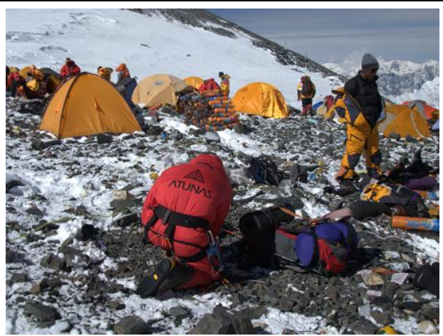
在海拔 7,950 的第四營，氧氣瓶堆積如山