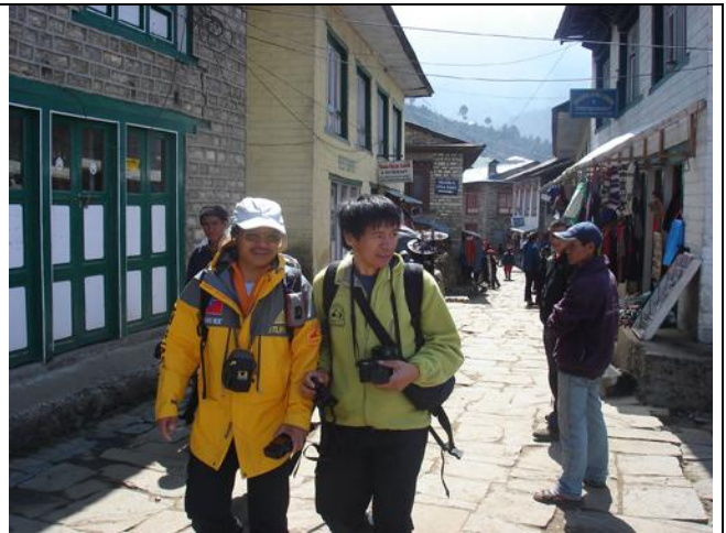
走進時光隧道，Lukla 的街道