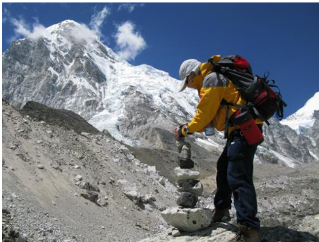
學習雪巴人的習俗-堆疊石頭，為攀登隊祈福