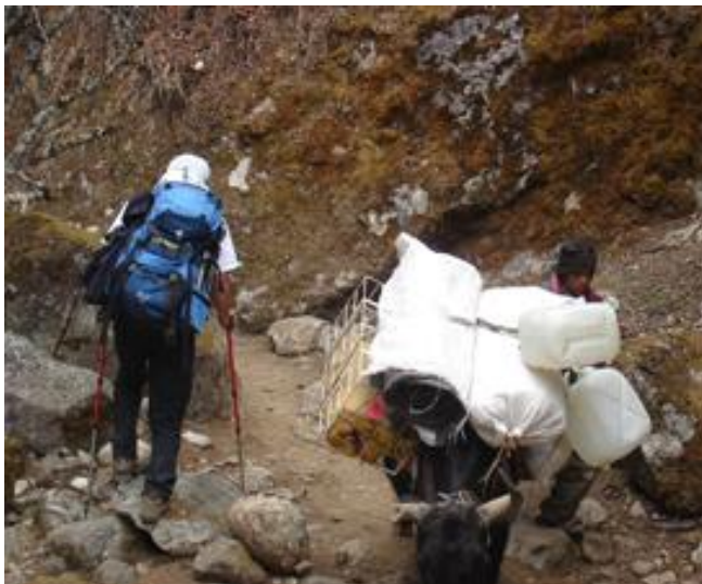
往基地營途中巧遇犛牛運輸隊