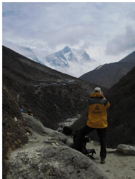
沿著沿著河谷，眺望世界第四高峰 Lhotse