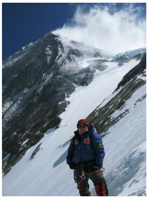
背面的聖母南峰，峰頂飄起了雪煙