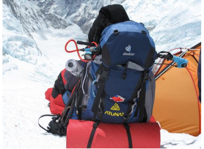
準備往更低的營地下撤囉！