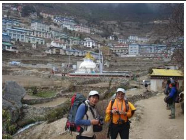
昆布山區最熱鬧的市集-Namche Bazar